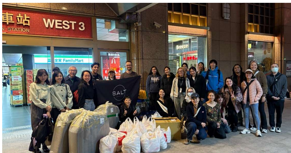
週間關懷與關懷包發放