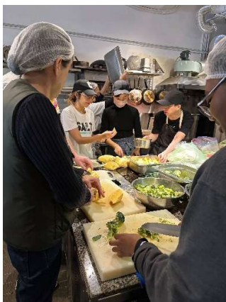
愛心廚房(便當製作) 廚房備料