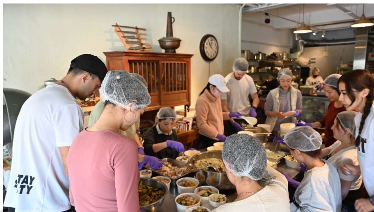
愛心廚房(便當製作) 便當裝盒