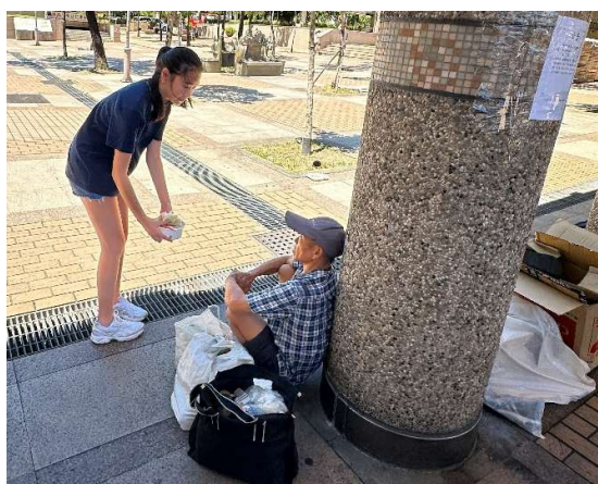
愛心廚房(便當製作) 便當分送