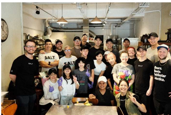
愛心廚房(便當製作) 新北國王企業夥伴