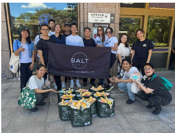
愛心廚房(便當製作) 便當分送