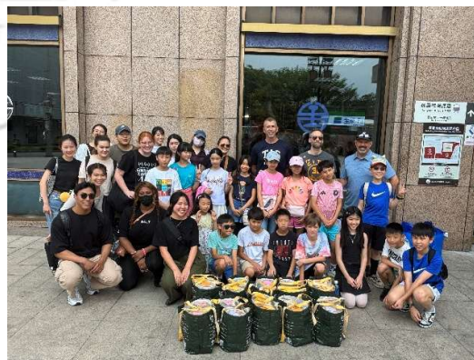
愛心廚房(便當製作) TAS 美國學校