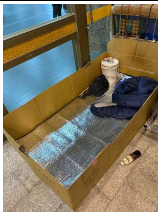
關懷包內容物(勸募)及鋁箔墊(自籌)